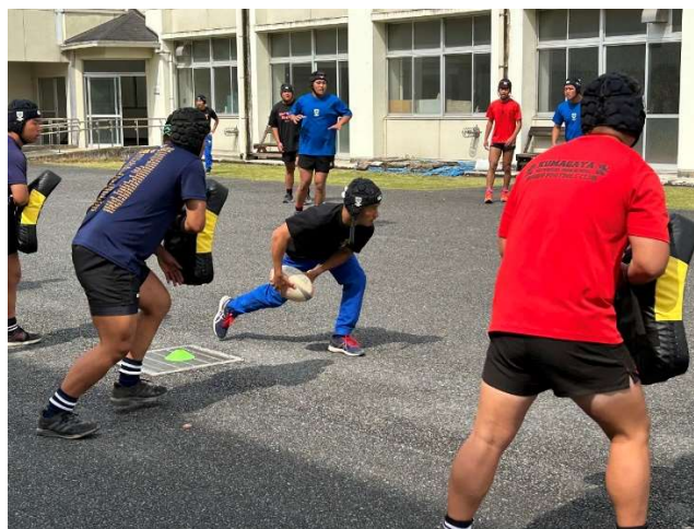
ビッグミットを使用した練習風景